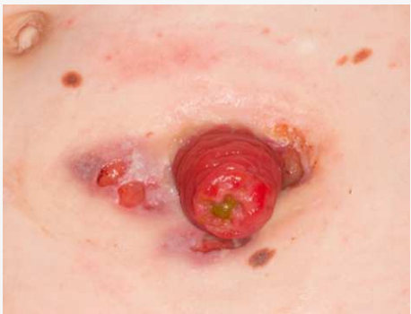
Pyoderma gangrenosum (2-5 %)