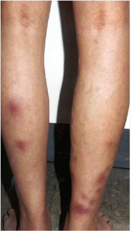
Erythema nodosum 15%