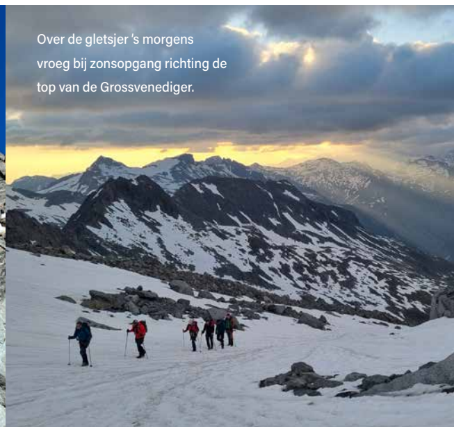
Over de gletsjer 's morgens vroeg bij zonsopgang richting de top van de Grossvenediger.