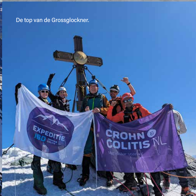
De top van de Grossglockner.