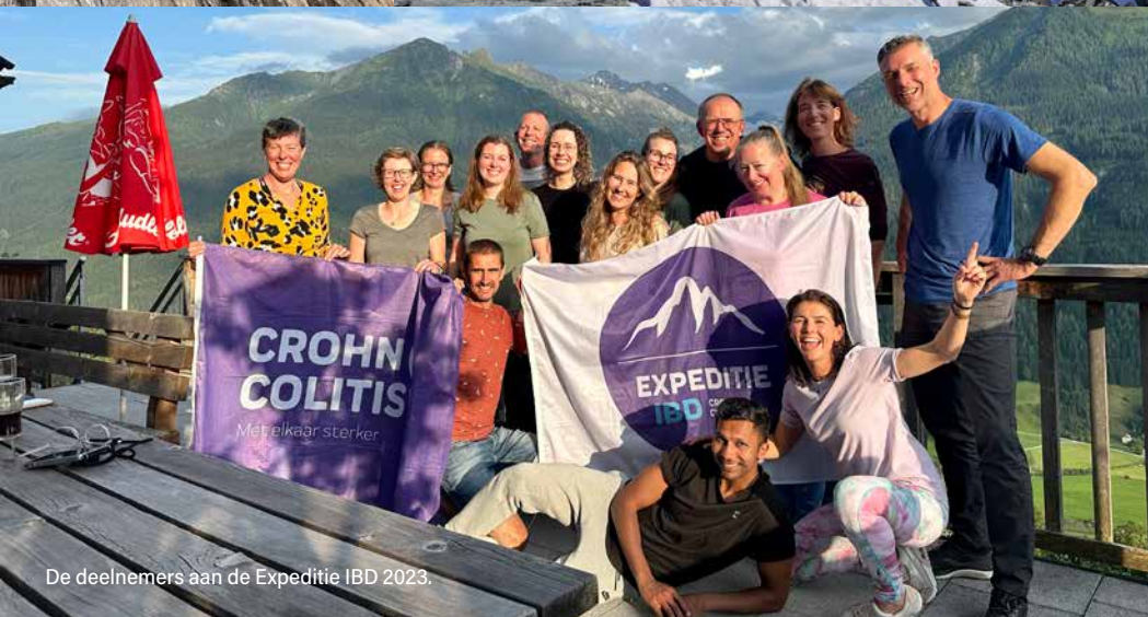
De deelnemers aan de Expeditie IBD 2023.