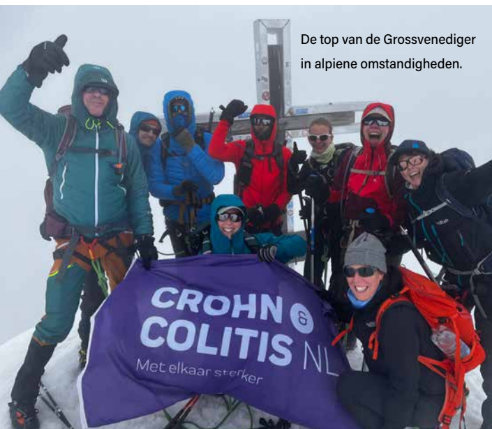
De top van de Grossvenediger in alpiene omstandigheden.