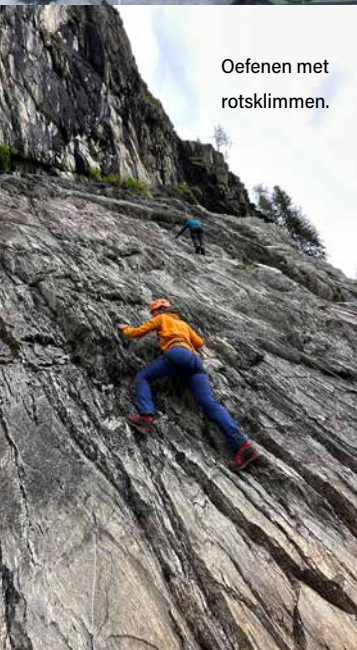
Oefenen met rotsklimmen.