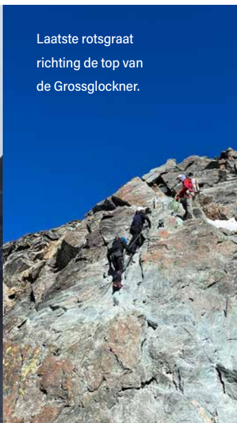
Laatste rotsgraat richting de top van de Grossglockner.